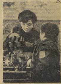
А. ВЫСКРЕНБЕВ.

Ребята тренируются по два-три часа в день. На морозе, в ветру. Недаром на Всесоюзных соревнованиях по картингу на приз «Пионерской правды» ГАИ МВД СССР наградила команду картингистов Воркутинского Дворца пионеров почетным призом «За развитие картинга в сложных климатических условиях».